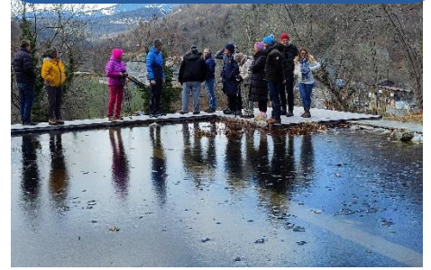
Eisbedeckter Naturpool im Garten des Schlosses